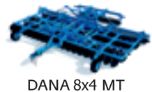
DANA 8x4 MT