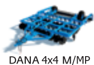
DANA 4x4 M/MP