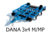
DANA 3x4 M/MP