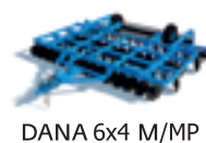
DANA 6x4 M/MP