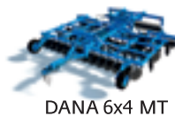
DANA 6x4 MT